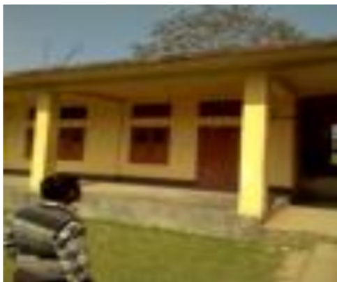
ভোটগ্ৰহন কেন্দ্ৰৰ সন্মুখৰ দৃশ্য