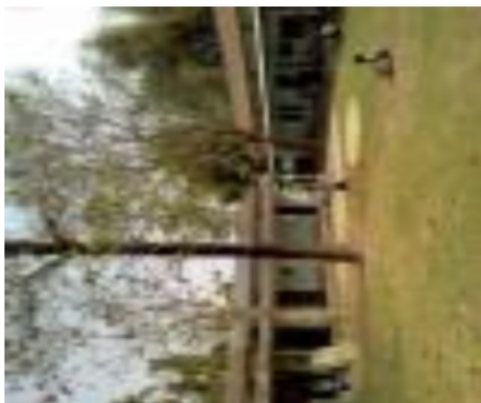
ভোটগ্ৰহন কেন্দ্ৰৰ সন্মুখৰ দৃশ্য