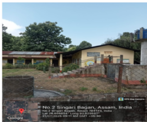
No 2 Singari Bagan, Assam, India No 2 Singari Bagan, Assam 784149, India Lat 26.604854, Long 92.829557 21/07/2025 09:11 AM GMT +05:30