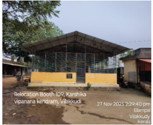
Relocation Booth 109, Karshika vipanana kendram, Vilakkudi 27 Nov 2025 2:29:40 pm Elampal Vilakkudy Kerala