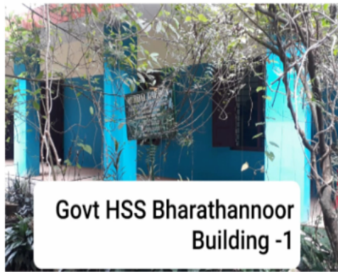
Govt HSS Bharathannoor Building -1