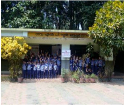
Polling Station Front View