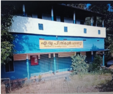
Polling Station Front View