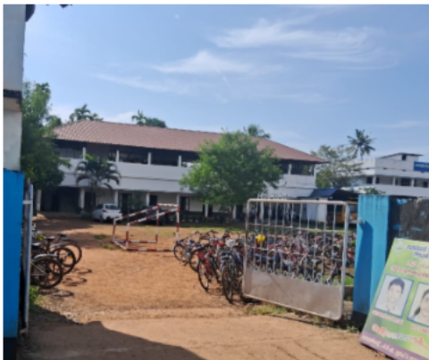
Polling Station Front View