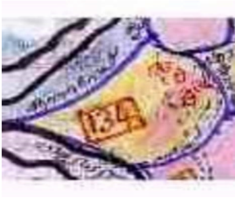
Google Map View