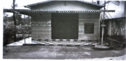
PHOTO OF PROPOSED POLLING BOOTH.