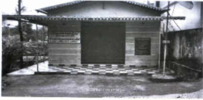
PHOTO OF PROPOSED POLLING BOOTH.