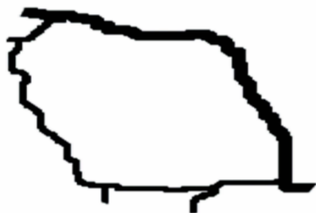
Google Map View