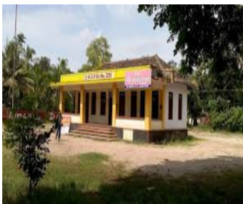
Polling Station Front View