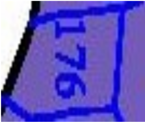
Google Map View