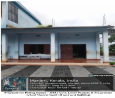
Manjeri, Kerala, India 8481487 Mysapattanam, Manjeri, Kerala 676517, India Co. 11-205827 N. Lat: 74.124694 07/07/2025 10:27 AM GMT +05:30 Proposed new Polling Station - 115A ( Govt. Lower Primary & Pre-primary school Manjeri town) (If more work building)