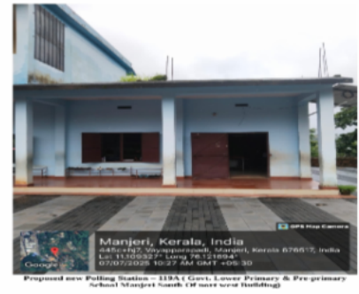
Manjeri, Kerala, India 8481487 Mysapattanam, Manjeri, Kerala 676517, India Co. 11-205827 N. Lat: 74.124694 07/07/2025 10:27 AM GMT +05:30 Proposed new Polling Station - 115A ( Govt. Lower Primary & Pre-primary school Manjeri town) (If more work building)