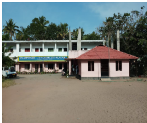
Polling Station Front View