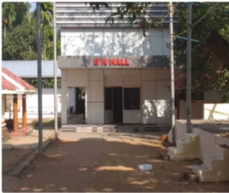
Polling Station Front View