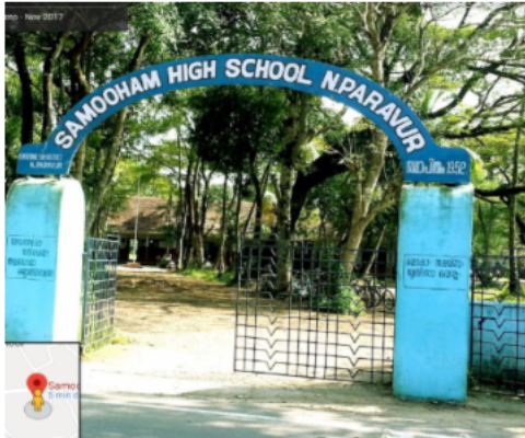
Polling Station Front View