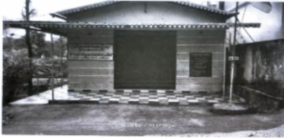
PHOTO OF PROPOSED POLLING BOOTH.

Handwritten signature വിദ്യാർത്ഥി സഹായക കമ്മിറ്റി പാലക്കാട്