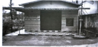
PHOTO OF PROPOSED POLLING BOOTH.

Handwritten signature വിദ്യാർത്ഥി സഹായക കമ്മിറ്റി പാലക്കാട്