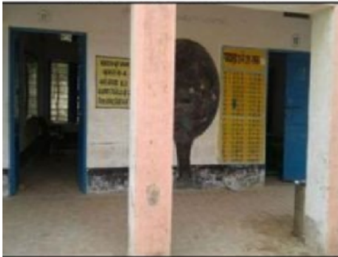
Building Front View