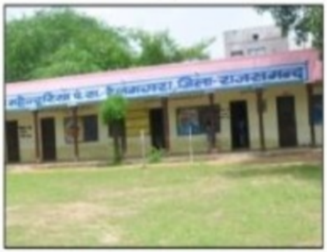
Building Front View