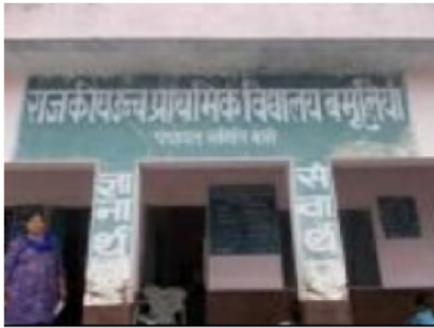
Building Front View