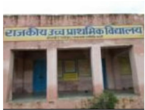
Building Front View