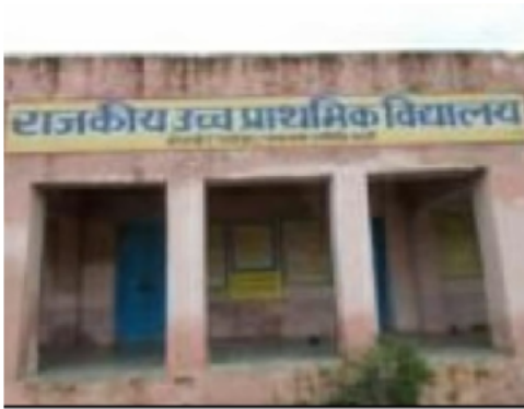
Building Front View