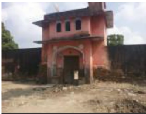
Building Front View