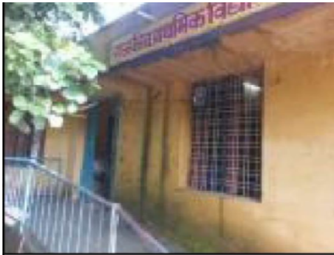
Building Front View