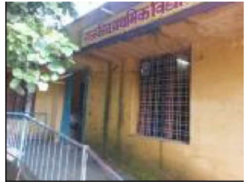
Building Front View