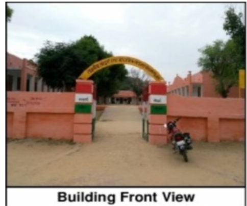
Building Front View