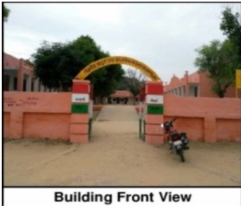
Building Front View