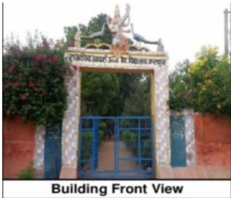
Building Front View