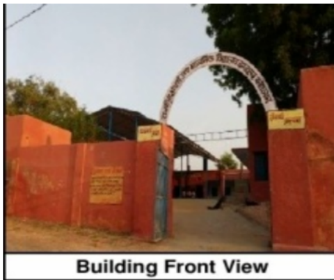
Building Front View