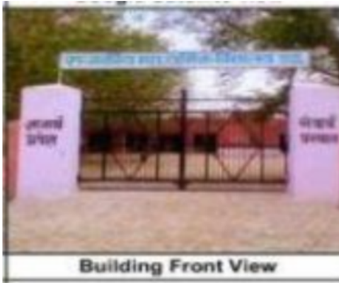
Building Front View