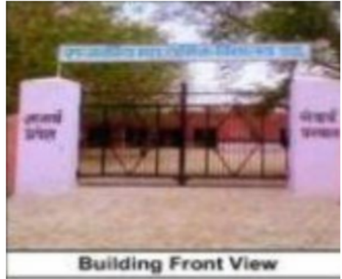
Building Front View