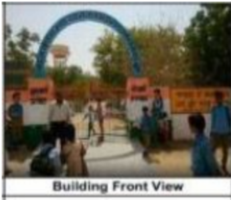
Building Front View