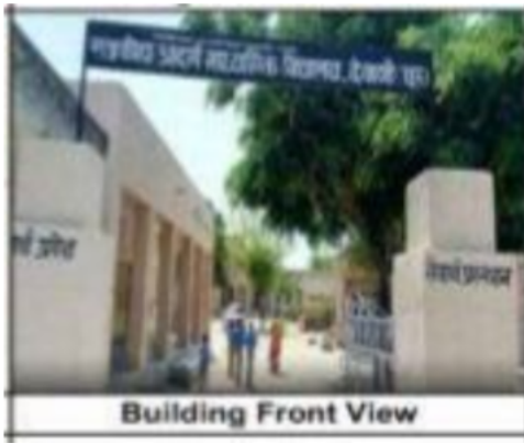
Building Front View