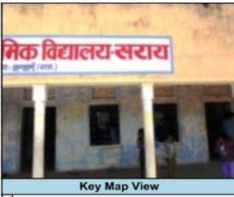
Key Map View