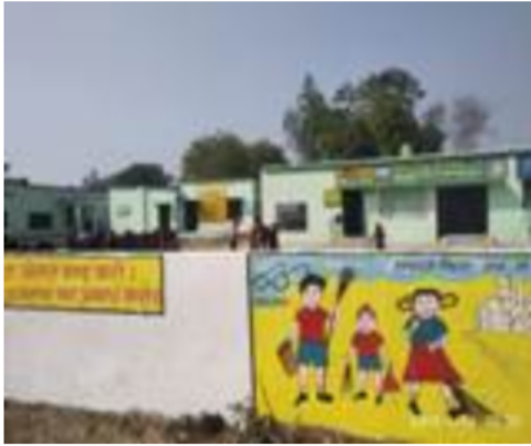
Polling Station Front View