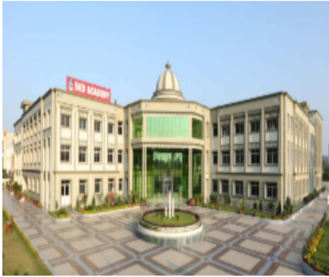
Polling Station Front View