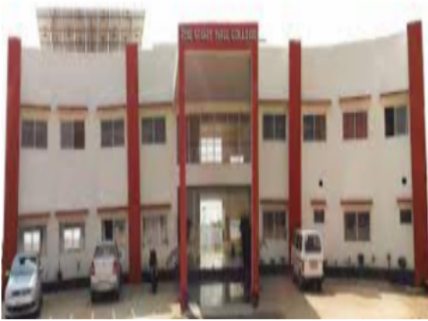
Polling Station Front View