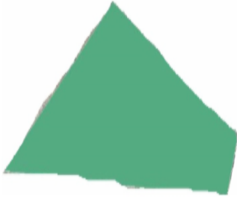
Google Map View