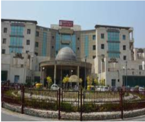
Polling Station Front View