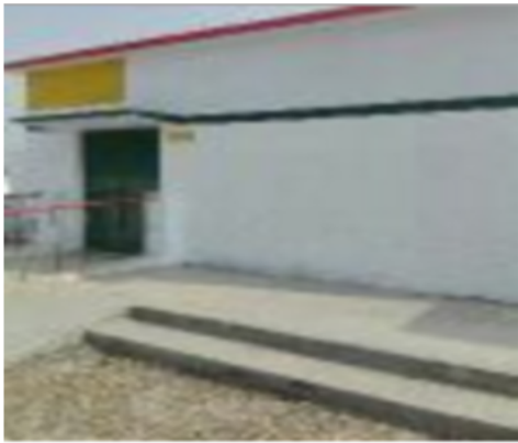
Polling Station Front View