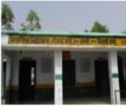
Polling Station Front View