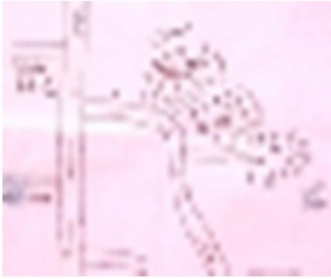
Google Map View