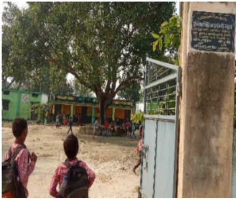
Polling Station Front View