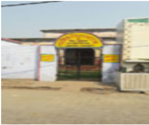
Polling Station Front View