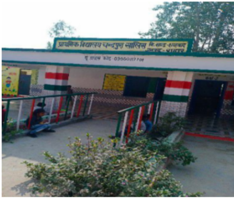
Polling Station Front View