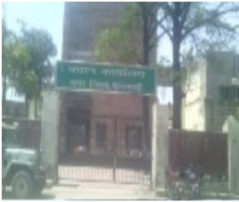
Polling Station Front View