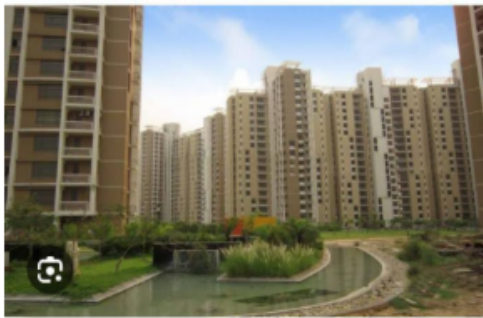
Unitech Horizon Pi Greater Noida - Reviews, Price,...