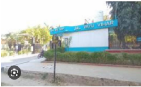
About Jalvayu Vihar, Greater Noida