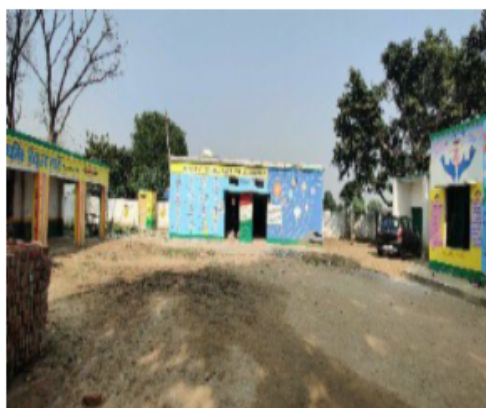
Polling Station Front View