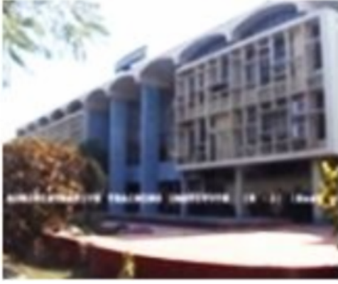
Polling Station Building Front View