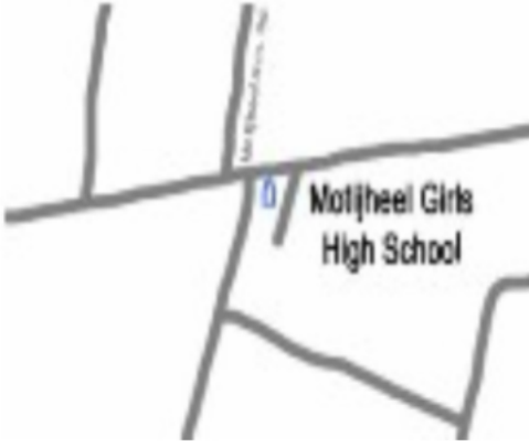
Google Map View