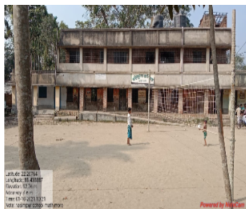
Map No: 22.20764, 88.438887 Date: 01-16-2021 13:21 Note: সম্পূর্ণ স্ক্রিনশট