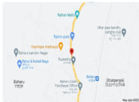
Map for 22.20764, 88.438887