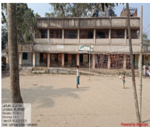
Map No: 22.20764, 88.438887 Date: 01-16-2021 13:21 Note: সম্পূর্ণ স্ক্রিনশট