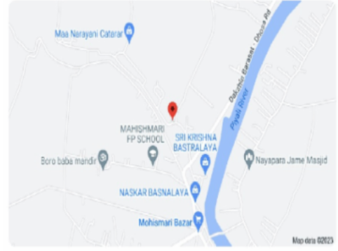
Map for 22.193814,88.569848